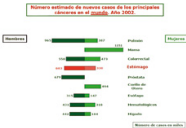
FIGURA 1.— Incidencia de los diversos tipos de cánceres en el mundo

Ya lo demostró magistralmente Studley 3 en el año 1936 con pacientes intervenidos de úlcera gástrica: los pacientes que habían perdido peso antes de la intervención quirúrgica fallecían significativamente más en el postoperatorio que los que no habían perdido peso (33,3% versus 3,5%). El estudio de Weinsier 4 y colaboradores pone en evidencia que los días de estancia hospitalaria incrementan considerablemente en los pacientes que al ingreso presentaban desnutrición severa. Von Meynfeldt 5 y colaboradores detectan en pacientes intervenidos de cáncer gástrico, de colon o de recto, una mayor incidencia de abscesos abdominales, sepsis y estancias hospitalarias más prolongadas en los pacientes desnutridos respecto a los que presentaban un estado de nutrición dentro de la normalidad. Dannhauser 6 y colaboradores encuentran mayor incidencia de complicaciones infecciosas en el grupo de pacientes con desnutrición.