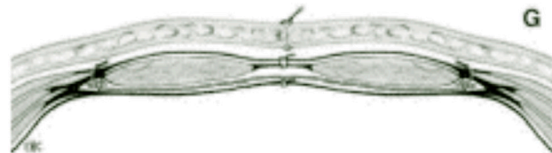
Fig. 2. Implantación retromuscular prefascial (Rives).