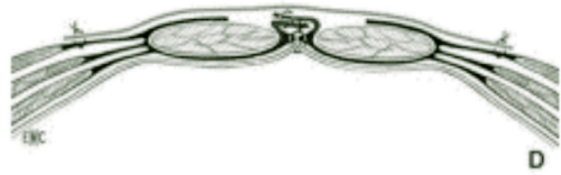
Fig. 1. Colocación de la prótesis premusculoaponeurótica (Chevrel).